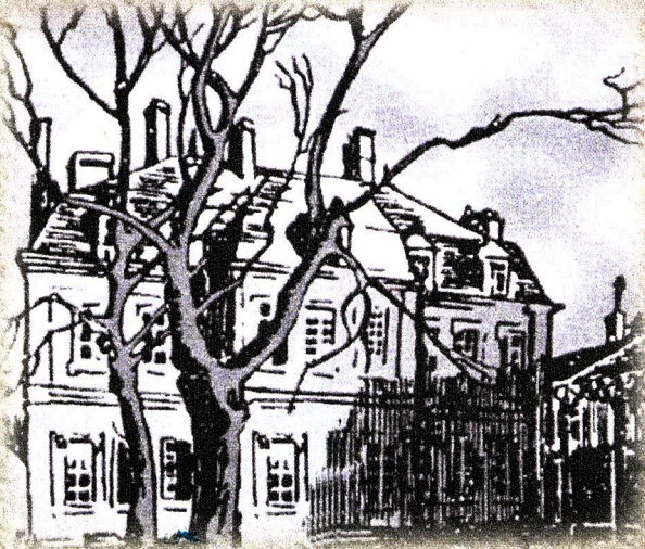
Dessin de Jean-Louis Boncoeur