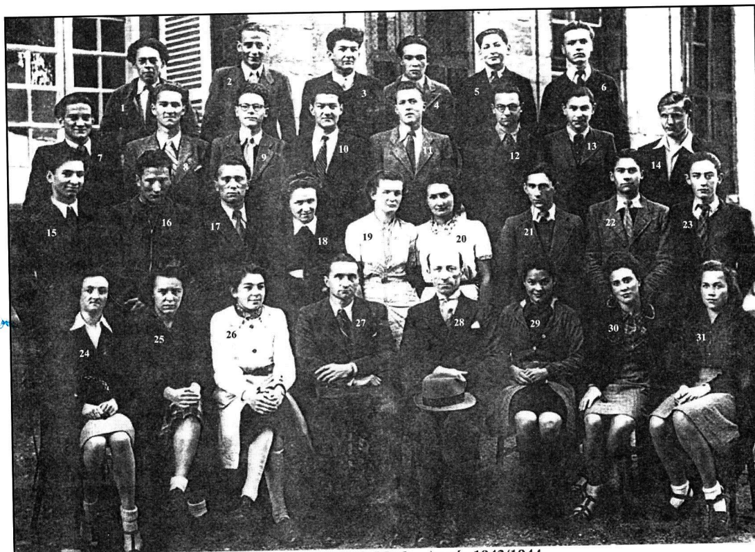
Classe de Philo & Math - Année 1943/1944