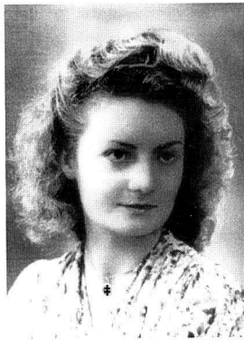
La croix de Lorraine autour du cou