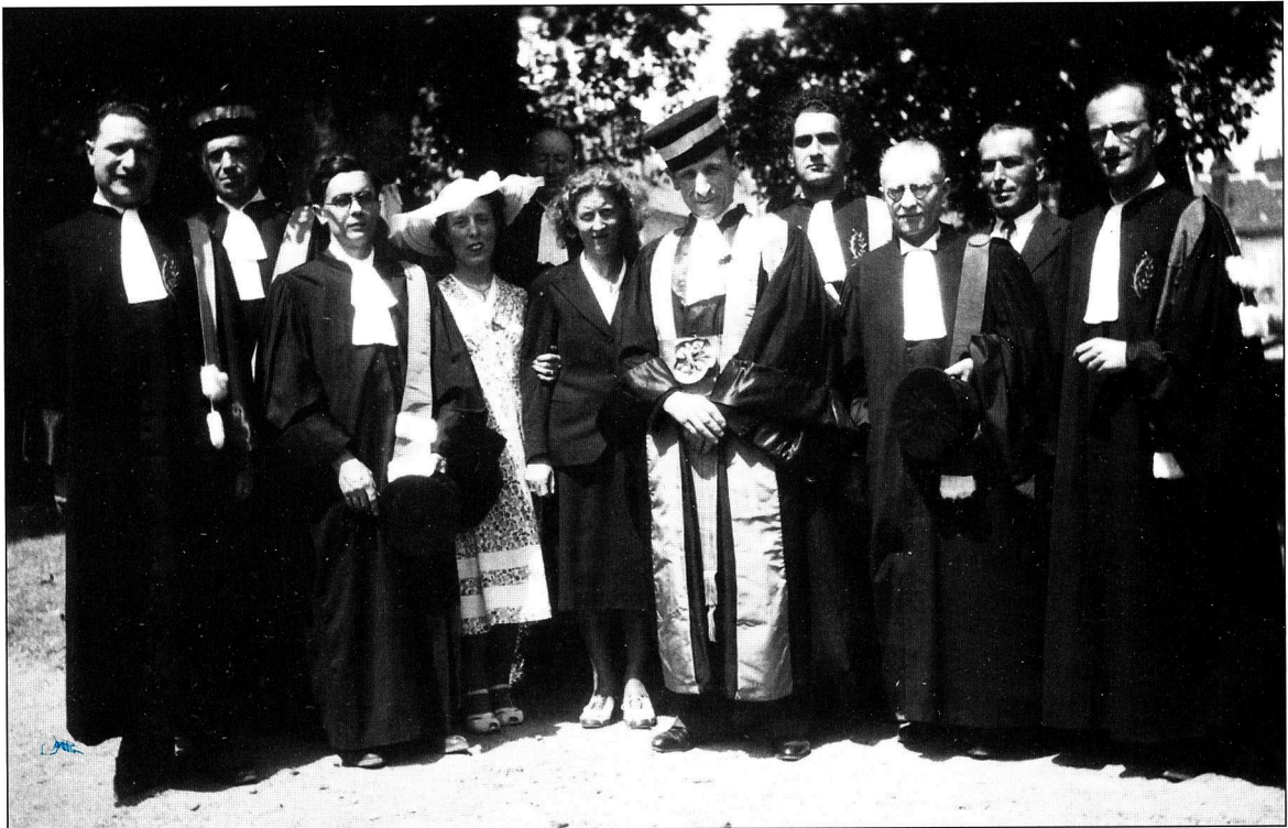
Distribution des prix dans les années 1945-1950

On notait la présence de Monsieur le Sous-Préfet en grande tenue passementée d'or, de Monsieur le Maire en jaquette portant écharpe tricolore, de l'Inspecteur d'Académie particulièrement entouré et congratulé...