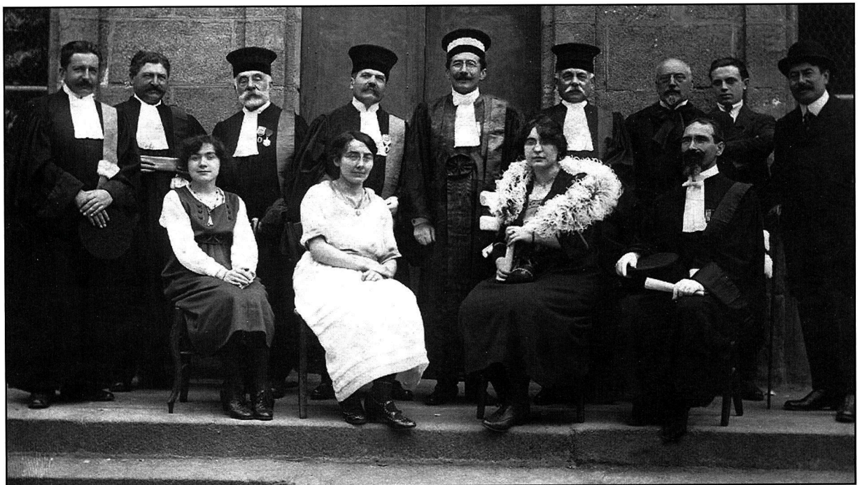
La distribution des prix entre les deux guerres.

Puis, avait lieu le regroupement - et l'appel ! - par classe, dans la cour d'honneur, en présence du corps professoral et de quelques notables.